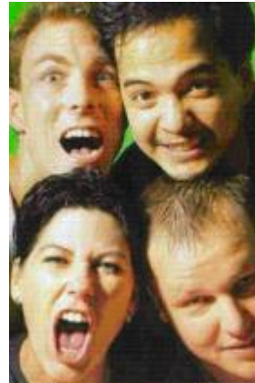
Pixies...back in the days

Der ehemalige Pixies-Chef, seine Taten und Untaten, sein Werk und Schaffen als Musical.